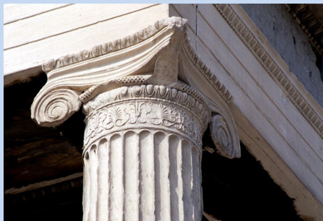
Columna del Erecteión, Atenas.